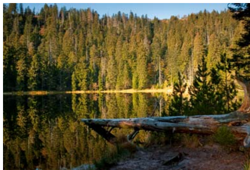
Der Wilde See im gleichnamigen Bannwald

In einem Nationalpark wird bewusst auf die Nutzung von Holz verzichtet, da die ungestörte natürliche Entwicklung Arten neuen Lebensraum eröffnet, der im Wirtschaftswald nicht mehr besteht. Der jährliche Ausfall an Nutzholz im Schwarzwald wäre mit vmtl. 30.000 bis 50.000 Festmeter vergleichsweise gering und entspricht in etwa dem Holzdurchsatz eines mittleren Sägewerks im Schwarzwald in 2 Monaten oder 0,5% des jährlichen Gesamteinschlags im Land. All das wird den Holzmarkt in Baden-Württemberg mengenmäßig oder durch höhere Holzpreise nicht sonderlich beeinflussen.