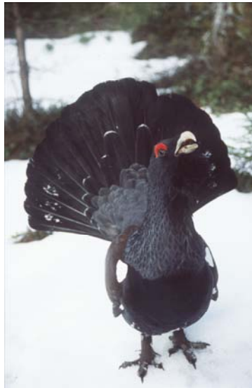
Ein balzender Auerhuhn

Ökonomisch zahlt sich die Einrichtung eines Nationalparks somit im Wesentlichen in den angrenzenden Naturpark-Gemeinden aus, da im Nationalpark selbst keine Hotels und Restaurants entstehen werden. Die Bedeutung der viel größeren Naturparkregion steigt mit einem weltweit bekannten Premium-Prädikat „Nationalpark“ und verleiht dem gesamten Nordschwarzwald ein renommiertes Alleinstellungsmerkmal. Im Doppel wirken Nationalpark im Naturpark besonders erfolgreich – das zeigen Beispiele in anderen Bundesländern 10 .