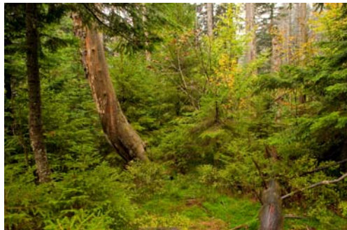
Im Bannwald Wilder See, Nordschwarzwald, ältester Bannwald in Baden-Württemberg - der Urwald von morgen!

beispielsweise die Nationalparks, die wenigen Bannwaldflächen in Baden-Württemberg (0,5%) oder die Naturwaldreservate in Bayern. Jahrhundertlange intensive Nutzung hat die natürlichen Wälder in Deutschland überwiegend in naturferne Forste verwandelt. Die Umtriebszeiten für Holz in Wirtschaftswäldern (Wuchszeit bis zur Aberntung) werden aufgrund steigender Nachfrage nach Holz immer kürzer. Diese jungen Forste sind im Gegensatz zu Urwäldern nicht in der Lage große Mengen an CO 2 zu speichern und damit einen Beitrag zum Klimaschutz zu leisten, viele walddtypische Tier- und Pflanzenarten finden dort keine Heimat mehr.